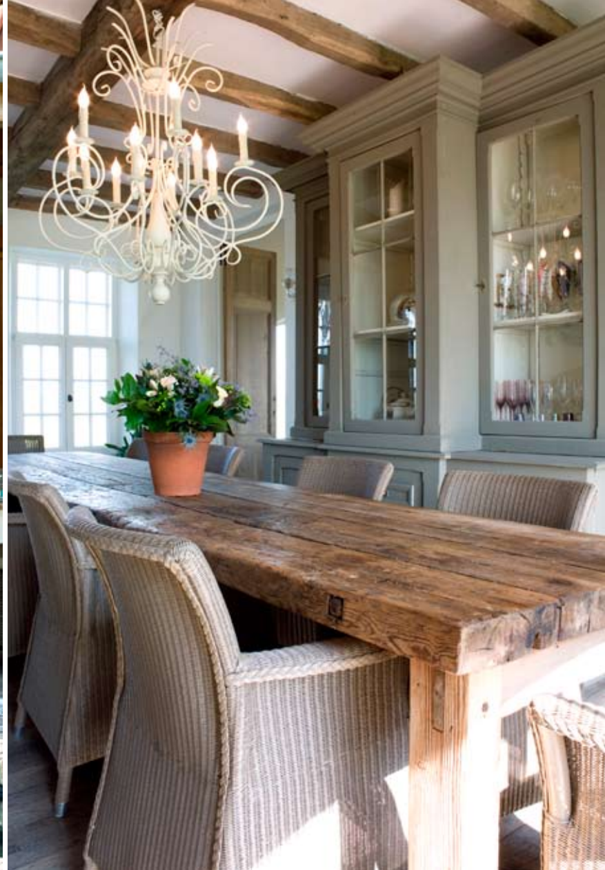
DE TAFEL IN DE EETKAMER IS EEN OUDE WERKBANK. DE NOG DUIDELIJK ZICHTBARE SPIJKERS TONEN DUIDELIJK DAT ER VROEGER VEEL AAN GEWERKT IS.

“Ook de gevel is afwisselend, met op de ene plaats een eikenhouten beplanking, wat verder een aardappelkleurig gekaleide gevelsteen en nog verder een gerecupereerde boerensteen. Ook panoramische ramen, stalen ramen en houten blokkramen wisselen elkaar af in verschillende groottes en vormen. Samen vormen ze een mooi geheel, maar door de grote variatie heeft de woning iets speels. Het lijkt alsof het huis in verschillende stappen ontstaan is en dat er al meerdere generaties in geleefd hebben.”